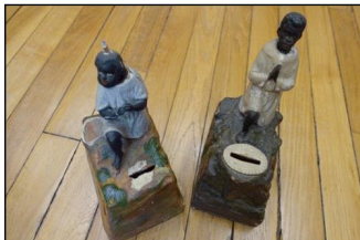
Tirelires missionnaires au Défap.

D'un côté, la guerre comme camouflet infligé à la mission chrétienne, dans le sillage de la mission civilisatrice dont l'Occident s'est prétendu investi. De l'autre, la guerre en « success story » pour la mission car, par la venue sur son territoire métropolitain de chrétiens malgaches, tahitiens, kanak, la guerre n'apporte-t-elle pas la preuve concrète que, de ce travail apostolique, un autre visage du protestantisme est en train d'émerger ?