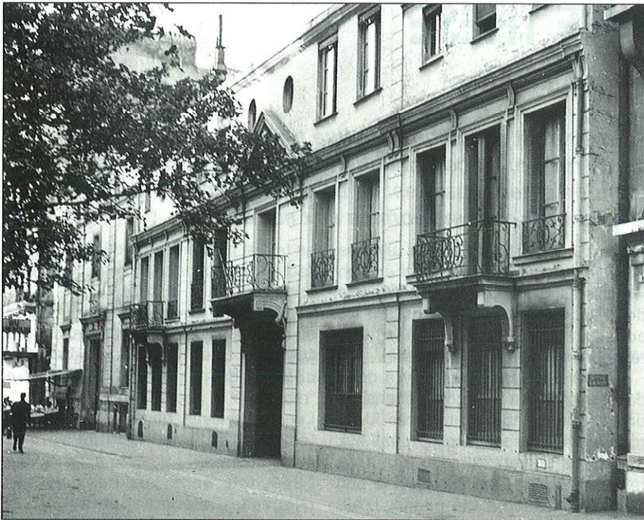
La première "Maison des Missions", à Paris, 85 boulevard Montparnasse (1823-1833).

est soit pro-catholique à l'extérieur de ses frontières, soit adepte d'un "laïcisme militant". Inversement, elle trouve le protestantisme doublement suspect, soit de se montrer anglophile, soit d'être favorable à une autonomie indigène et d'y contribuer. Au total, nous trouvons, plutôt qu'une compréhension de plus en plus forte, l'alternance de phases de conflits et de périodes de coopération.